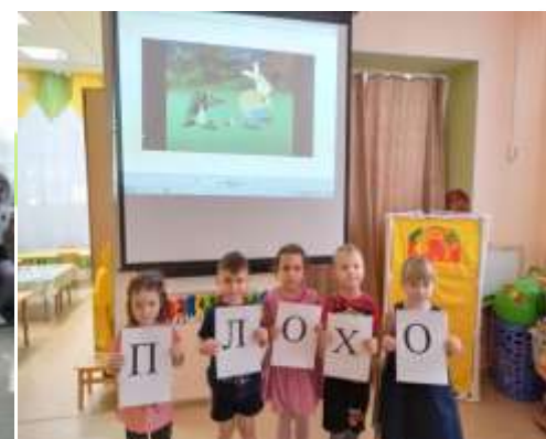
Игровые обучающие ситуации